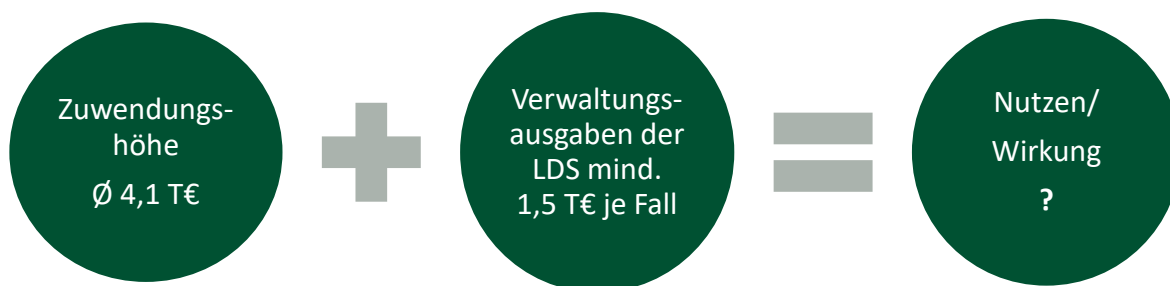
Abbildung 1: Ausgaben und Wirksamkeit einer Zuwendung der Haushaltsjahre 2022/2023