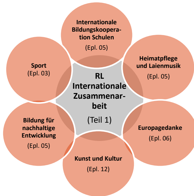
Abbildung 2: Förderkonkurrenzen zur RL Internationale Zusammenarbeit